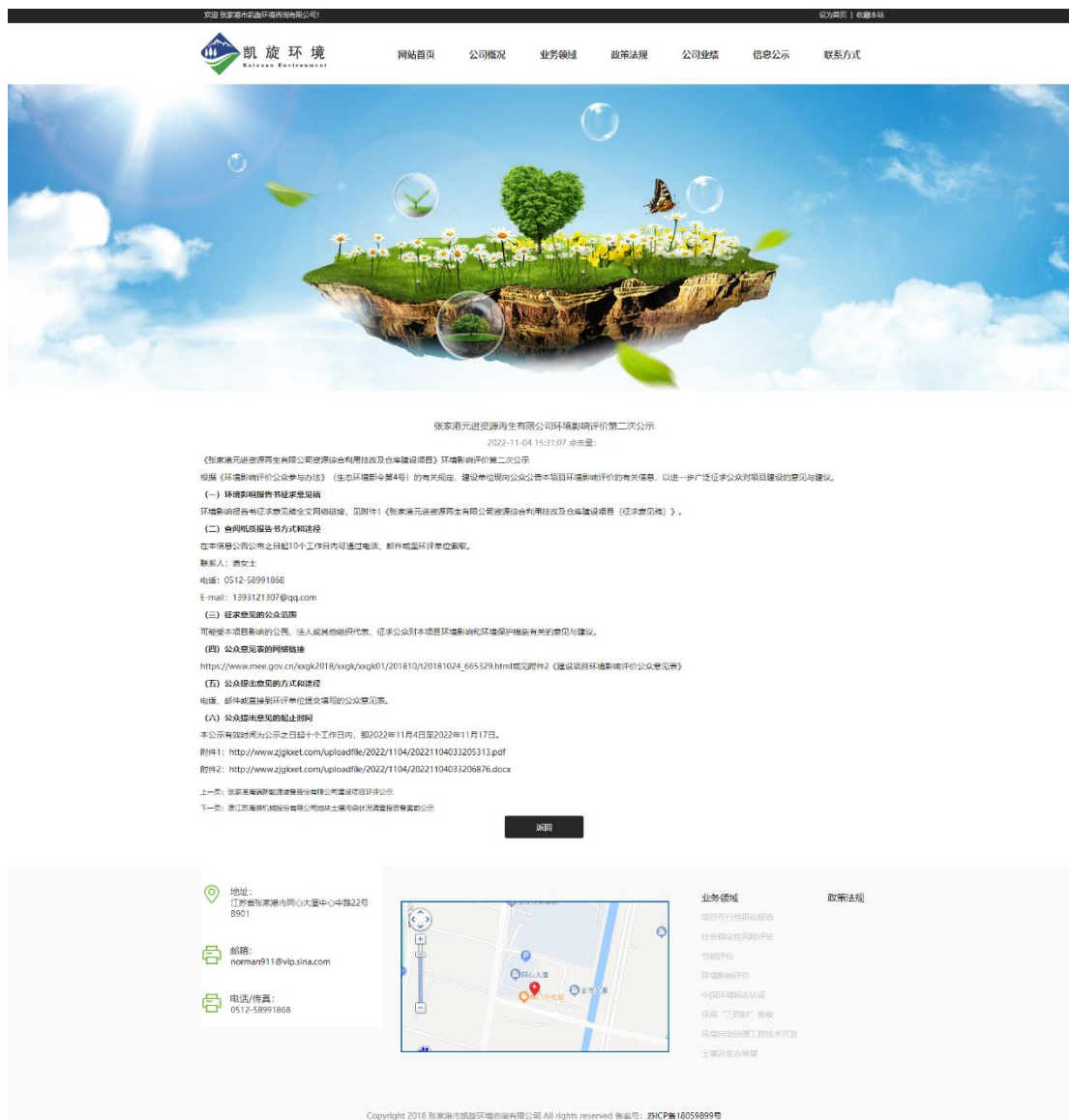
图 3-1 征求意见稿网站公示截图